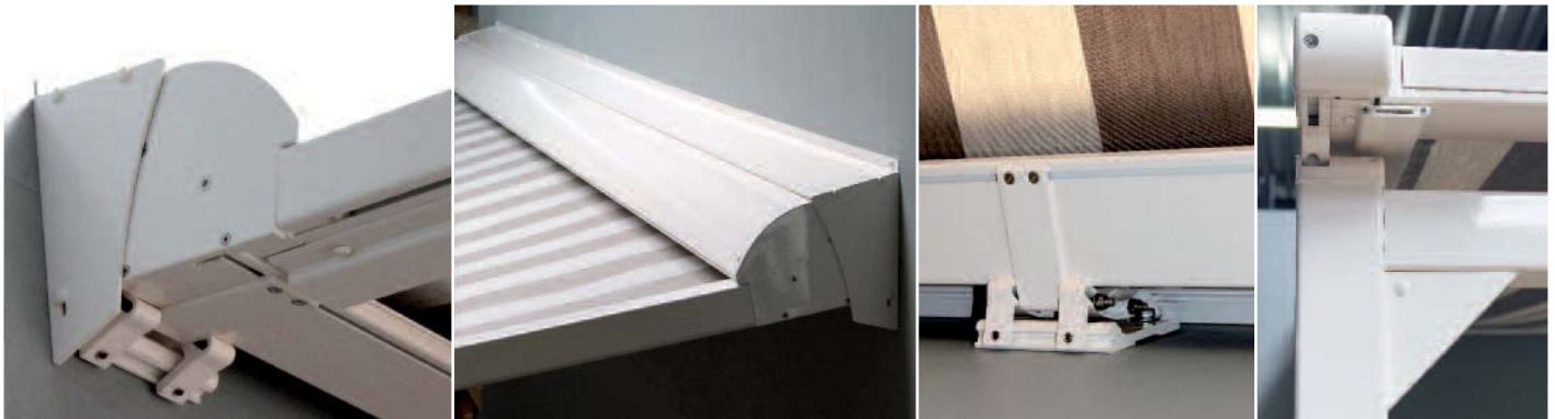
Coffre avec étanchéité contre façade

Le Piazzola pergola est équipée d'un coffre très esthétique permettant la fixation au mur ou contre le support et un habillage pour l'étanchéité